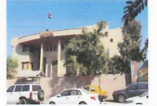
الجهة المسؤولة الهيئة العامة للضرائب - فرع الكرادة

الإثنين: ٠٨:٣٠ - ١٤:٣٠ الثلاثاء: ٠٨:٣٠ - ١٤:٣٠ الأربعاء: ٠٨:٣٠ - ١٤:٣٠ الخميس: ٠٨:٣٠ - ١٤:٣٠ الجمعة: مغلق السبت: مغلق الأحد: ٠٨:٣٠ - ١٤:٣٠