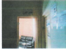
الوحدة المسؤولة مكتب مدير الفرع

مدير فرع الكرادة - الهيئة العامة للضرائب رقم الهاتف: ٩١٣١ ١٨٦ ٧٩٠ ٩٦٤+