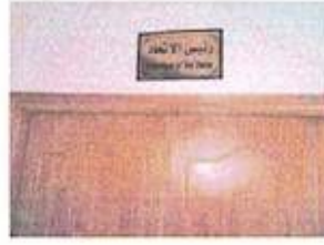
الوحدة المسؤولة رئيس اتحاد الغرف التجارية العراقية

رئيس اتحاد الغرف التجارية العراقية البريد الالكتروني: almthar@gmail.com