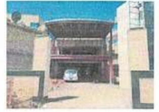
الجهة المسؤولة اتحاد غرف التجارة العراقية شارع السعدون , البريد الالكتروني: info@ficc.org.iq

الإثنين: ٨:٠٠ - ١٤:٠٠ الثلاثاء: ٨:٠٠ - ١٤:٠٠ الأربعاء: ٨:٠٠ - ١٤:٠٠ الخميس: ٨:٠٠ - ١٤:٠٠ الجمعة: مغلق السبت: مغلق الأحد: ٨:٠٠ - ١٤:٠٠