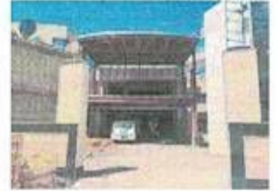
الجهة المسؤولة اتحاد غرف التجارة العراقية شارع السعدون ، البريد الإلكتروني: info@ficc.org.iq

الإثنين: ٠٨:٠٠ - ١٤:٠٠ الثلاثاء: ٠٨:٠٠ - ١٤:٠٠ الأربعاء: ٠٨:٠٠ - ١٤:٠٠ الخميس: ٠٨:٠٠ - ١٤:٠٠ الجمعة: مغلق السبت: مغلق الأحد: ٠٨:٠٠ - ١٤:٠٠