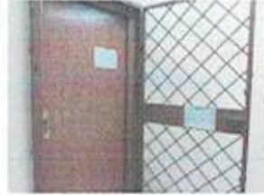
الوحدة المسؤولة الصندوق / اتحاد الغرف التجارية العراقية

الإثنين: ٠٨:٠٠ - ١٤:٠٠ الثلاثاء: ٠٨:٠٠ - ١٤:٠٠ الأربعاء: ٠٨:٠٠ - ١٤:٠٠ الخميس: ٠٨:٠٠ - ١٤:٠٠ الجمعة: مغلق السبت: مغلق الأحد: ٠٨:٠٠ - ١٤:٠٠